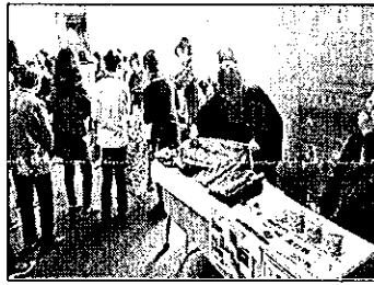
《芽ぶきの会、さとうきび事業》