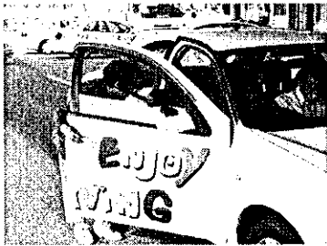
よろしくお願ひします