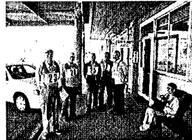
さあ 今から運転です

開催日時 平成29年11月15日(水) 14時20分～16時20分 開催場所 古賀自動車学校(現地集合 14時00分) 古賀市千鳥5丁目4-5 TEL 0120-29-9779 受講対象者 シルバー人材センター会員及び60歳以上の一般市民 受講定員 30名(先着受付、但し定員になり次第締め切ります) 受講内容 講義 実地運転 古賀自動車学校 講義 粕屋警察署予定 受講料 無料(シルバー人材センター負担)